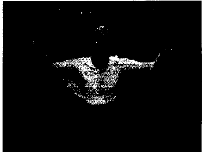
Kilpailujen voittaja joutui perinteiden mukaisesti ottamaan voittokylvyn Bodominjärvessä